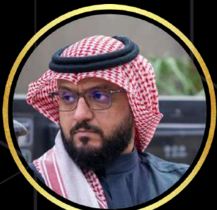
51 الأستاذ وليد آل غنيم وكيل الاستراتيجية وزارة الاستثمار