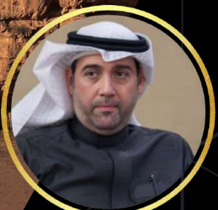
52 الأستاذ مشعل الذكر مدير عام وزارة الطاقة