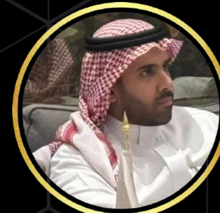
56 الدكتور مشعل الرشيد مستشار سمو وزير الدفاع وزارة الدفاع