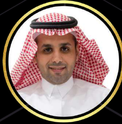
17 المهندس الحجاب الحازمي الوكيل المساعد لتخطيط وتطوير الموارد البشرية وزارة التعليم