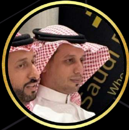
71 الأستاذ يعقوب الفيافي المشرف العام على المراسم وزارة الدفاع