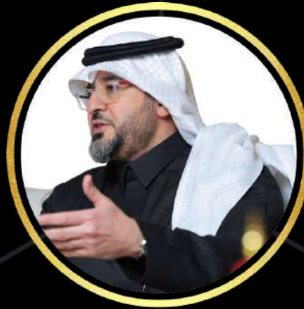
23 الأستاذ أحمد السويلم الرئيس التنفيذي المركز الوطني لتنمية القطاع غير الربحي