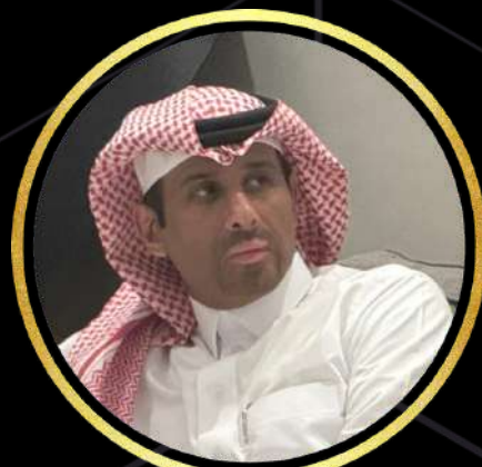
60 اللواء الدكتور عبدالكريم الجهني وزارة الدفاع