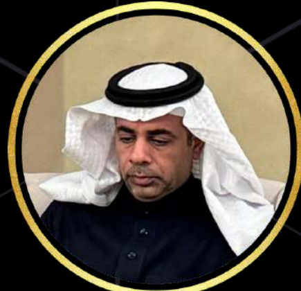
50 الأستاذ ماجد العمري نائب المحافظ الهيئة العامة للعقار